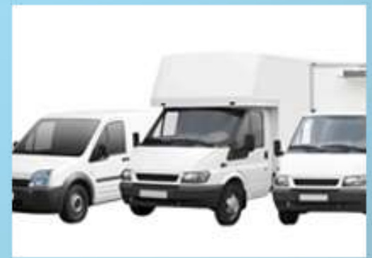
Unidades de reparto y cajas secas