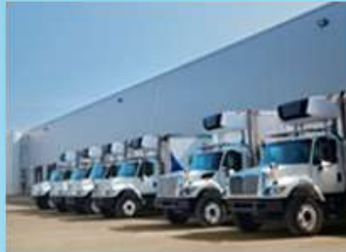
Flotillas y Refrigerados