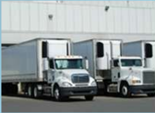
Transportes de Carga y Remolques